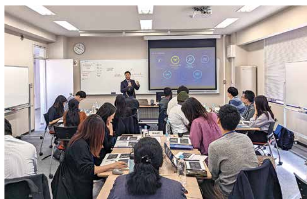
ビジネスのためのAI