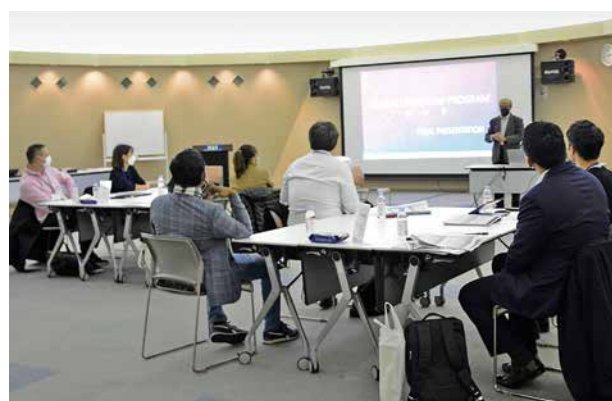
プレゼンテーション(発表会)