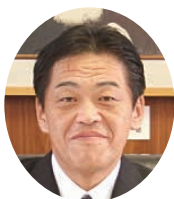
南魚沼市長 林 茂男氏