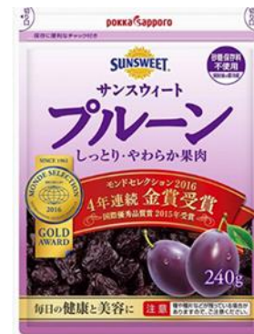
プルーン アマゾンで入手できます。