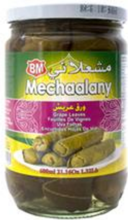
塩水漬けブドウの葉