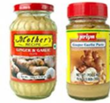
ジンジャー&ガーリックペースト Garlic&Paste ナマステフーズ ¥ 616