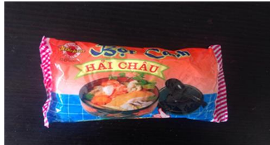
ベトナム塩 アマゾンで入手できます。