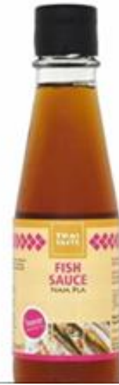
ナンプラー（魚醤） アマゾンで入手できます。