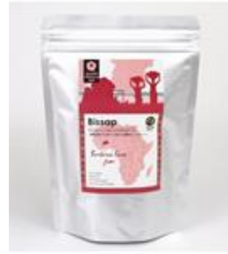
ハイビスカスティー